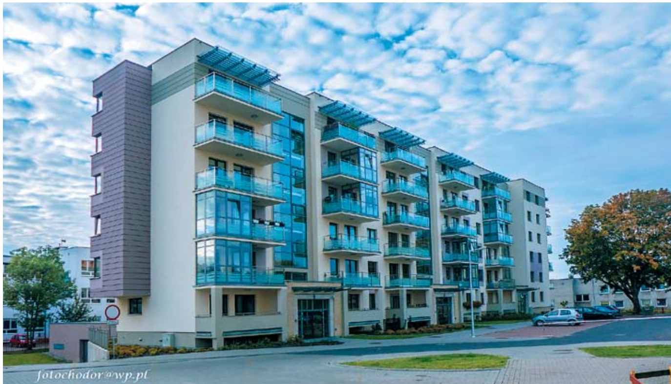
Budynek mieszkalny przy ul. Kołobrzeskiej 7 A w Olsztynie

oddatku być zauważonym, a nawet nagrodzonym.