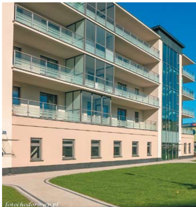
Budynek mieszkalny przy ul. Piłsudskiego 52 w Olsztynie