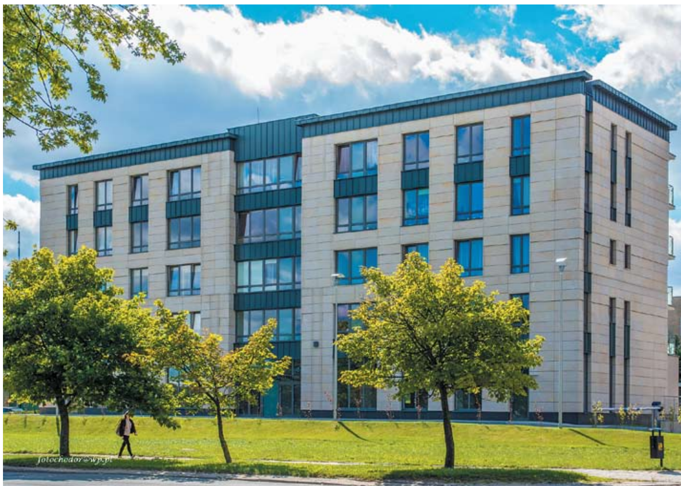
Budynek mieszkalny przy ul. Piłsudskiego 52 w Olsztynie