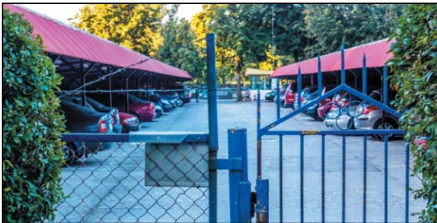
for. R. Chodor

2) „Spółdzielnia jest w złej sytuacji finansowej i chce podreperować kasę kosztem użytkowników parkingów” - Spółdzielnia jest w dobrej kondycji finansowej, natomiast opłaty za miejsca parkingowe nie stanowią dochodu spółdzielni. Średnia opłata za jedno miejsce wynosi netto 8,60 zł miesięcznie plus należny podatek VAT (każdy parking ma inną stawkę). W opłacie tej nie ma żadnego zysku, jest to wyłącznie zwrot kosztów ponoszonych przez spółdzielnię. Wszystkie parkingi społeczne położone są na działkach gruntu należących do całej spółdzielni, a nie do poszczególnych pojedynczych osób. Koszty dotyczące parkingów (podatek od nieruchomości, opłata za użytkowanie wieczyste terenu i koszty administracyjne) ponoszą wszyscy członkowie spółdzielni ok. 10.000 osób, natomiast miejsca parkingowe posiada do wyłącznego osobistego użytku tylko 969 osób (w tym są osoby nie związane ze spółdzielnią) i to w ocenie zarządu spół-