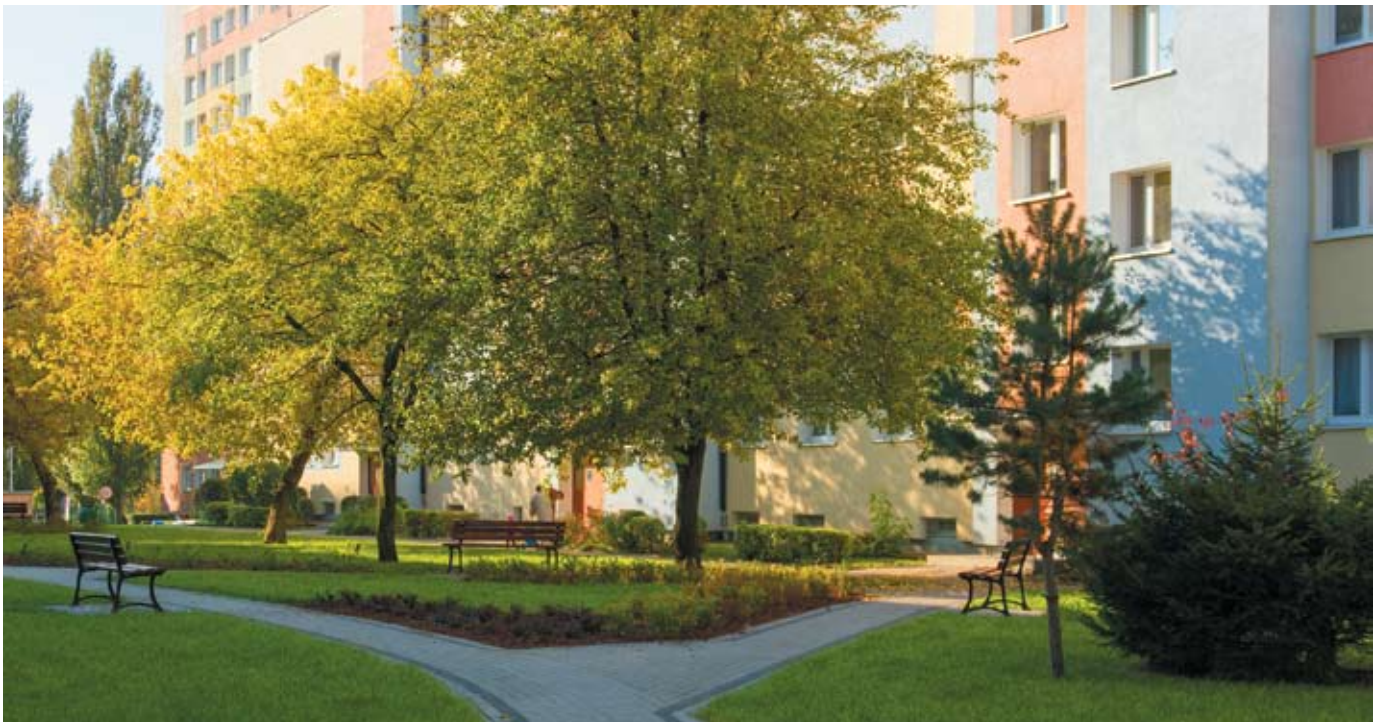
fol. R. Chodor

Kwiecień kończymy dobrą informacją. Projekt Spółdzielni Mieszkaniowej Pojezierze „Rewitalizacja Blokowisk”, zrealizowany dzięki dofinansowaniu UE, zdobył I miejsce w plebiscycie zorganizowanym przez TVP i Ministerstwo Infrastruktury i Rozwoju. Kolejna inwestycja na liście rankingowej, to Droga Ekspresowa S 7 Olsztynek-Nidzica. Dalsze miejsca zajęły Eko-Mariny: budowa ekologicznych mini przystani wraz z systemem odbioru i segregacji odpadów na wybranych obszarach regionu warmińsko-mazurskiego oraz rozbudowa, modernizacja i wyposażenie zespołu laboratoriów edukacyjno-badawczych technologii, jakości i bezpieczeństwa zdrowotnego żywności UWM i Techno-Park w Ełku. Satysfakcjonujący jest również fakt, że nasz projekt usytuował się na ósmym miejscu w kraju (na 80 wytypowanych inwestycji) pod względem liczby głosów. Rekordzistą w skali całej Polski okazał się projekt z województwa świętokrzyskiego: