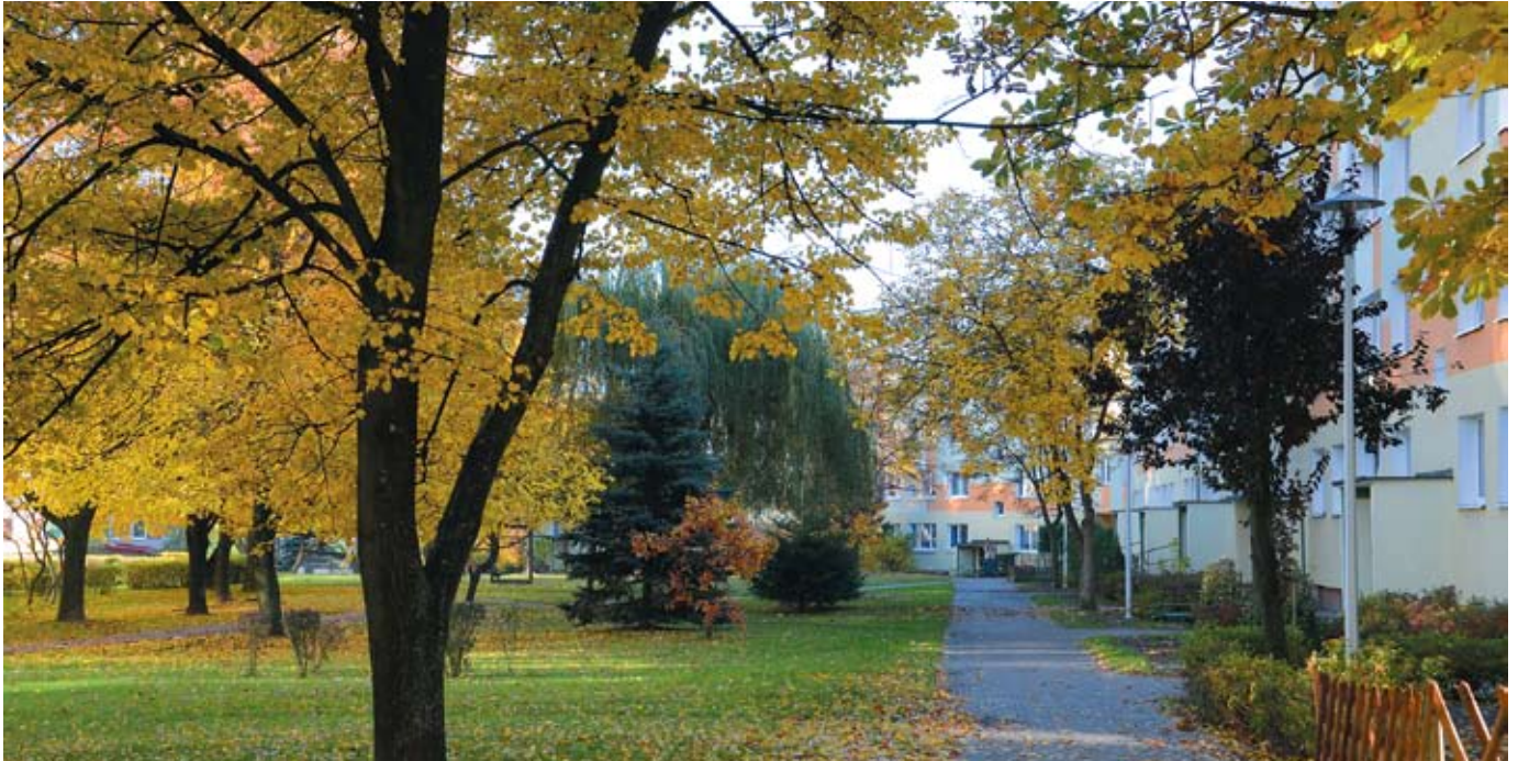
fol. R. Chodor

O nieodzowności zieleni na terenach naszych osiedli jest przekonana większość ich mieszkańców. Rośliny pochłaniają dwutlenek węgla i wydzielają tlen, nawilżają powietrze, dają schronienie ptakom i owadom, latem przyjemny cień; stanowią tło i urozmaicenie osiedli.