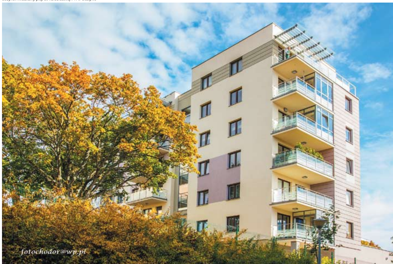
Budynek mieszkalny przy ul. Kołobrzeskiej 7 A w Olsztynie