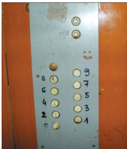
Już na pierwszy rzut oka widać, że ten panel sterowania w windzie przy ul. Kotobrzeskiej 13i przeszedł swoje.

Oczywiście „ziemia” określa stan klatek schodowych i piwnic przed remontem, dobrze nam znany. Mieszkańcy osiedli „Kormoran” i „Pojezierze” doskonale wiedzą, jak wyglądały tzw. części wspólne ich domów, a niektóre z nich – jeszcze wyglądają, choć to ostatnie miesiące tego post PRL-wskiego designera. Był to widok niezmienny od kilkudziesięciu lat,