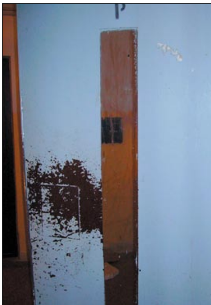
Te drzwi do windy lata świetności mają już za sobą.

A teraz, proszę Państwa, że posłużę się tym razem popularnym sloganem: „elegancja - francja”. Warto podkreślić, że planując remonty kierowano się w równym stopniu estetyką, co wysoką ja-