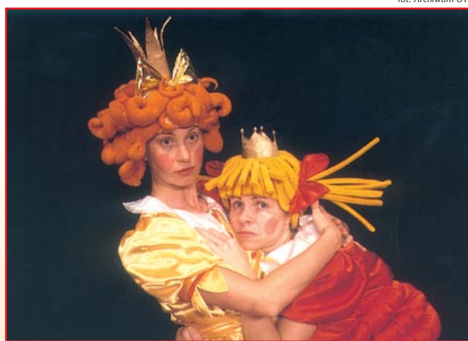
fol. Archiwum OTL

JP – W zupełności się z Panią zgadzam. Pamiętam, jeszcze z dzieciństwa, mieszkaliśmy wtedy w Bartoszczach, ale wożono nas do teatru w Olsztynie. „Czerwony Kapturek” był wtedy blisko Dworca. To był stary, przepiękny teatr, który bardzo poruszył moją wyobraźnię. Tęsknię za takim klasycznym teatrem lalkowym. Mnie się to tak kojarzy, jak to kiedyś, z dziada pradziada, zasiadano w kręgu rodziny, czy znajomych, gdzieś w kuchni, snuto opowieści, czytano bajki, a ze zwykłego przedmiotu, jakim była na przykład drewniana łyżka, opowiadający czy czytający potrafił zrobić postać, posługując się zwykłym gestem, animacją. Dziecięca wyobraźnia dopowiadała na podstawie tylko tego gestu całej kontekst, scenierię opisywanej słowem sytuacji. Wyobraźnia to ogromne bogactwo.