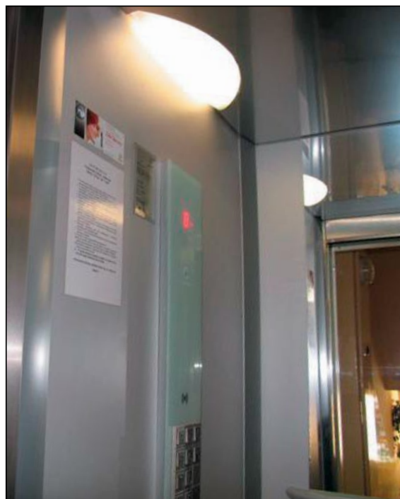
Windy takie jak ta od tego roku zostały zainstalowane w 12. budynkach.

W wielu klatkach wymieniono już windy. Te nowe, Schindler 6300, o udźwigu 475. kg, które mogą pomieścić do sześciu osób, zapewniają, jak pisze producent, większe bezpieczeństwo oraz komfort dla klientów, gości i mieszkańców. Windy spełniają naj-