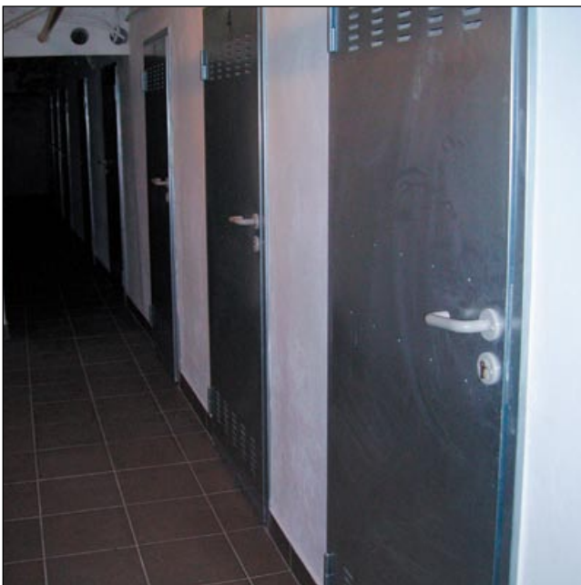
... i po remoncie – ul. Kołobrzeska 14a.

niepotrzebne wydawanie pieniędzy. To nie wszystko. Ekipy pracujące na przykład przy kładzeniu wykładzin sygnalizowały również przypadki swobodnego „bojkotowania” zmian. Zdarzało się bowiem, że niektórzy mieszkańcy – na szczęście nie byli to częste przypadki – ostentacyjnie, pomimo prośb, chodzili po świeżo naklejonych wykładzinach, zamiast miejscach do tego wyznaczonych. Po takich spacerach zostawały widoczne nawet do dzisiaj ślady. Filozofom, a może psychologom należałoby powziąć rozważenie kwestii, dlaczego niektórzy zamiast pozytywnych zmian upierają się przy czymś co jest