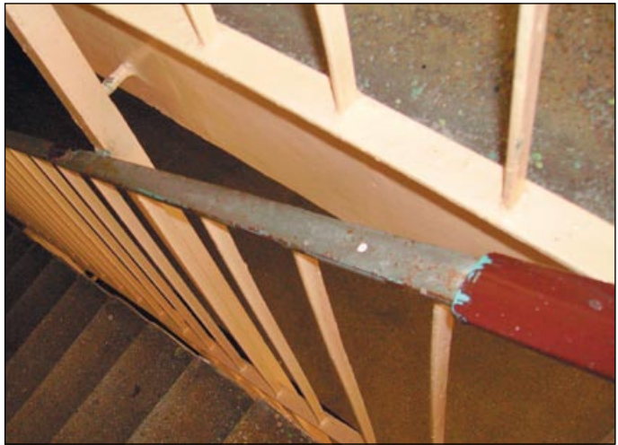
Tak wyglądają, jeszcze, poręcze w budynku przy ul. Kołobrzeskiej 13i.