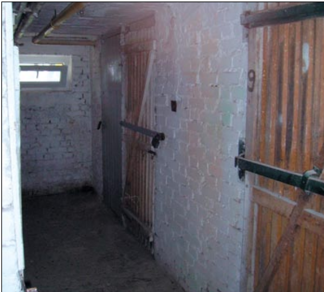
Piwnica przed remontem – ul. Wyszyńskiego 26.