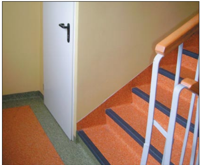
A tak prezentuje się klatka schodowa w budynku przy ul. Dworcowej 27.