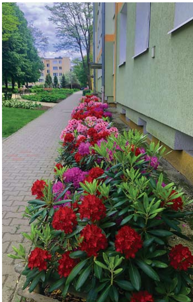
fol. A. Smoczyńska