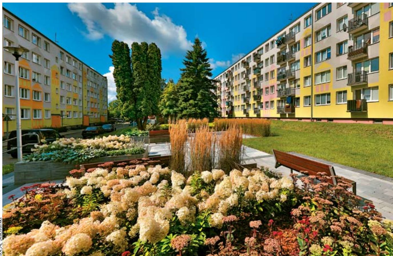
fol. A. Stachurski