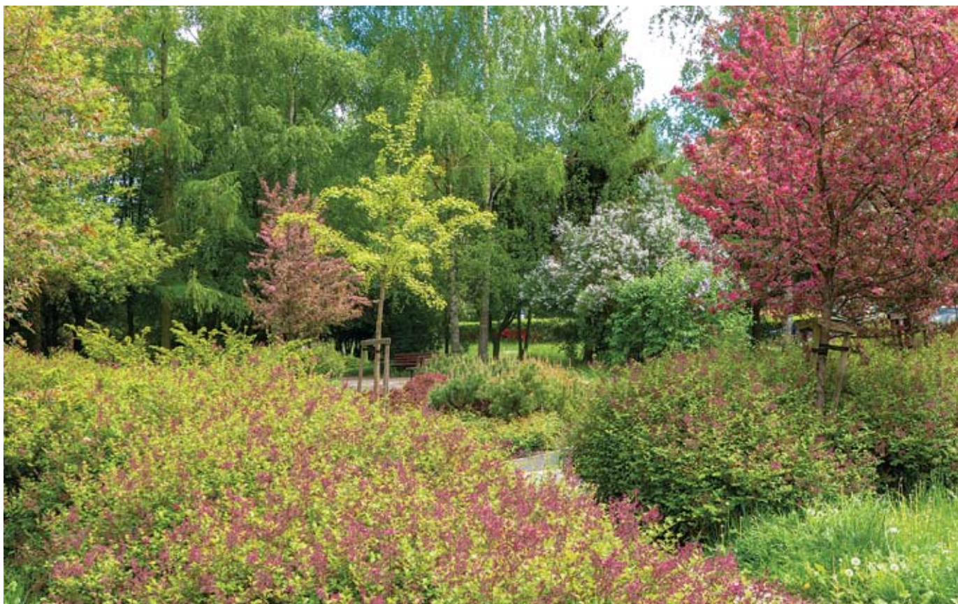
fol. R. Chodor

kwitnienia, przedogródki i skwery nadal cieszą oko. Tak samo jest z krzewami, które długo nie gubią liści. Część roślin zmienia ich barwy, co również ubogaca kompozycje.