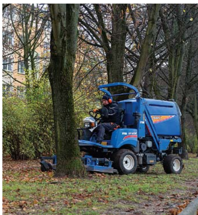
fol. A. Smoczyńska