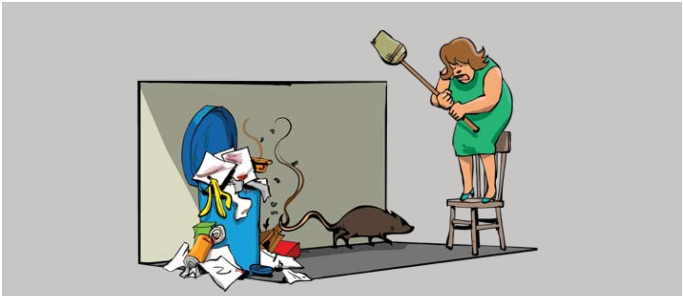
rys. A. Smoczyńska

Szczury to bardzo inteligentne zwierzęta, zresztą, jak wiele innych gatunków zwierząt, które zaryzykowały i wybrały miasto na swój drugi dom, po tym pierwszym, którym powinno być łono przyrody.