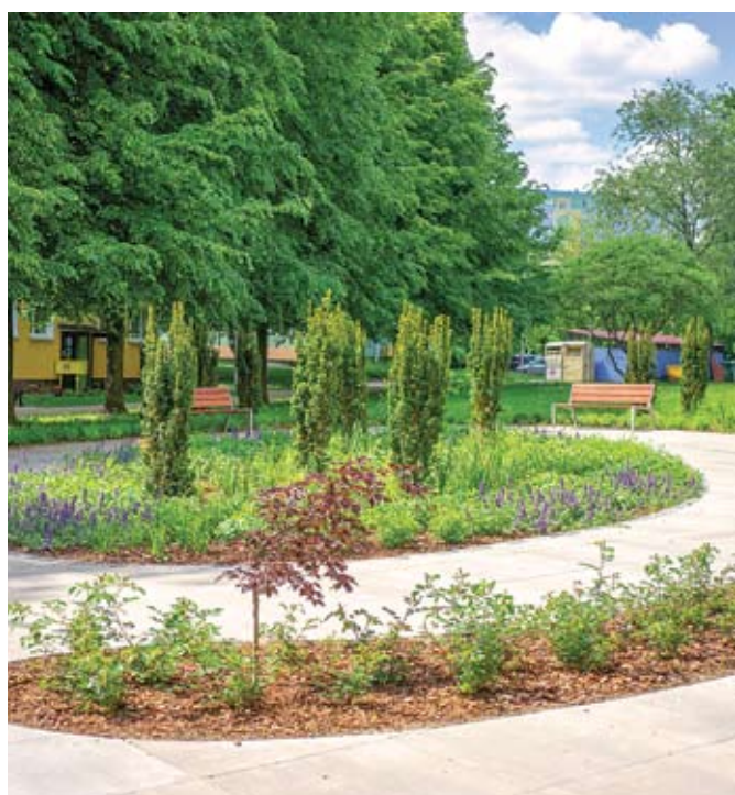
fol. R. Chodor