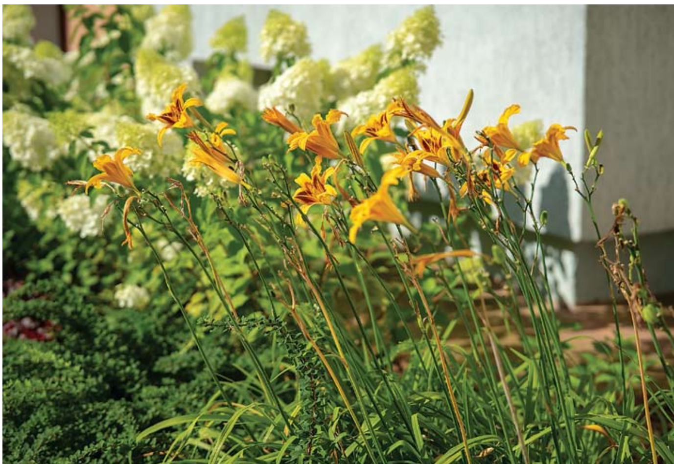
fol. R. Chodor