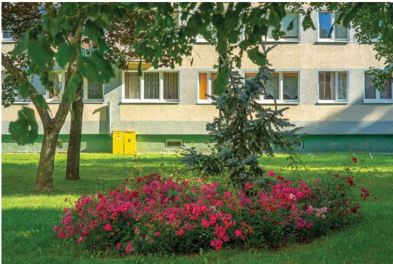
fol. R. Chodor