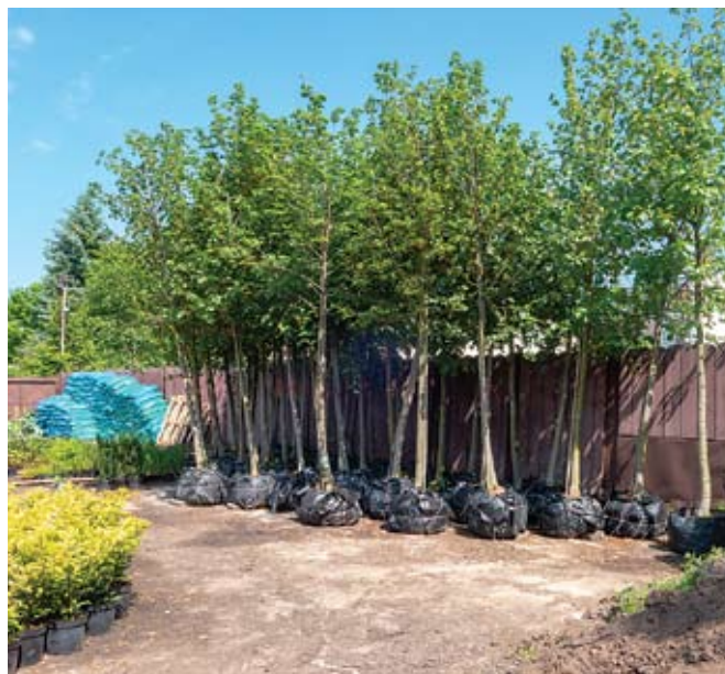
fol. R. Chodor

Ktoś, kto mieszka w domku jednorodzinny, rano wychodząc do pracy lub szkoły musi bardzo uważać pod nogi, albo wziąć łopatę i samemu przetrzeć sobie szlak. Nikt mu nie przyjdzie z pomocą, chyba, że wynajęta firma lub życzliwy sąsiad. Szybka i fachowa reakcja pracowników utrzymania zieleni w spółdzielni docenia się tym bardziej, ponieważ wiadomo, że regularne odśnieżanie i zgrabianie liści to nie wszystko, czym codziennie się ci ludzie zajmują.